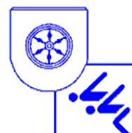
Stadtschwimmverband Osnabrück e.V.